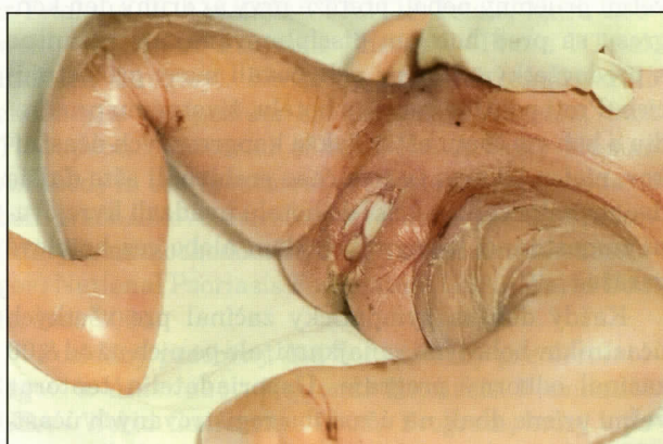
Obr. 4. CBs - tvorba fisúr v podbrúšku, v ingvínach, v podkolení a v oblasti členkov.