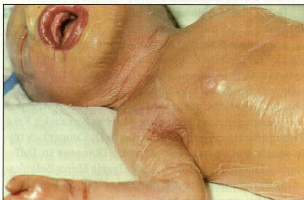
Obr. 1. CBs - typická lesklá membrána. Tvorba fisúr na zápästí a v axile.

MUDr. Zoltán Szép Detská kožná klinika DFNSP Limbova 1 833 40 Bratislava